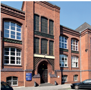
Foto: Campus Mönchengladbach, wo der Fachbereich Wirtschaftswissenschaften der Hochschule Niederrhein angesiedelt ist.