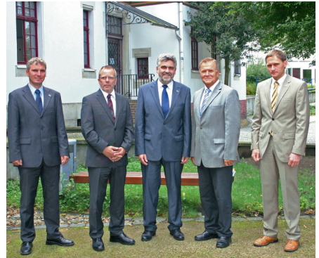
Vertragsunterzeichnung über Zusammenarbeit im dualen Bachelor-Studiengang BWL - Kooperation zwischen Hochschule Harz und Industrie- und Handelskammer Magdeburg.

Weitere Informationen: → www.wi.uni-muenster.de