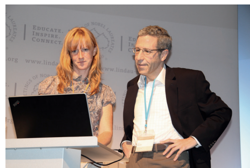
Prof. Dr. Eric S. Maskin bereitet seinen Vortrag auf dem Nobel Laureate Meeting in Lindau vor.