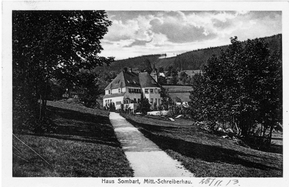
Abb. 2: Postkarte mit Motiv Haus Sombart, Mitt.-Schreiberhau

Allseitige“ – der Verf. der Familienbücher sei – + habe gedacht, daß es vielleicht doch ein Pandolfini oder sonst ein Herr X. war, 2042 obwol ja die Forschung jetzt soviel ich weiß nicht im Zweifel über die Autorschaft A.'s ist.