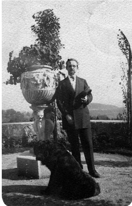
Abb. 3: Postkarte mit Fotografie Werner Sombart