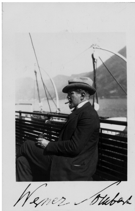
Abb. 4: Fotografie von Werner Sombart

Werner Sombart an Wilhelm Bölsche Berlin, 02.11.1927 (Postkarte)